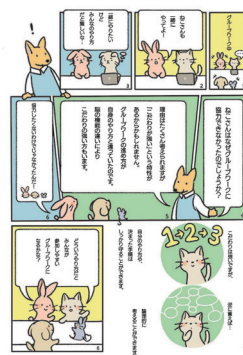
关于发展障碍的科普漫画