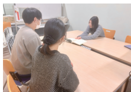
为有发展障碍的学生提供支援